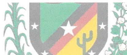
ALECSANDRO BEZERRA DOS SANTOS PREFEITO

GABINETE DO PREFEITO DE CAMALAÚ – 21 de março de 2019.